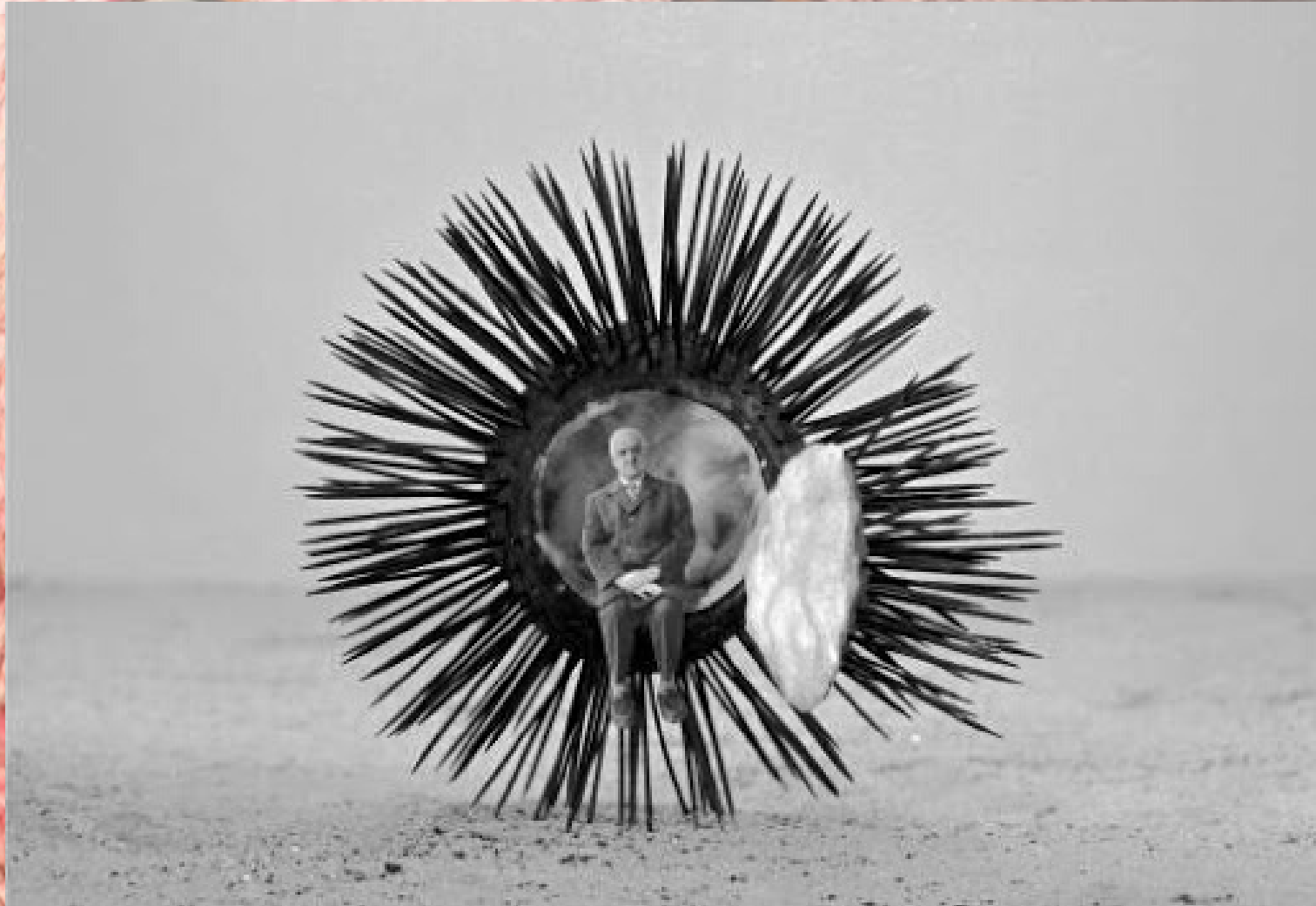
Gilbert GARCIN les précautions élémentaires

Cet artiste réalise avec beaucoup d'humour des mises en scène photographiques où il apparaît dans des situations poétiques ou surréalistes. Ici, assis dans un nid douillet au creux d'un oursin.