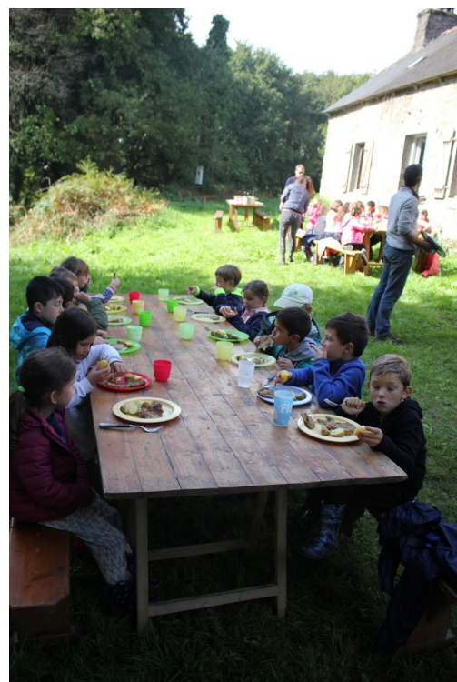
On a mangé chez Fine.