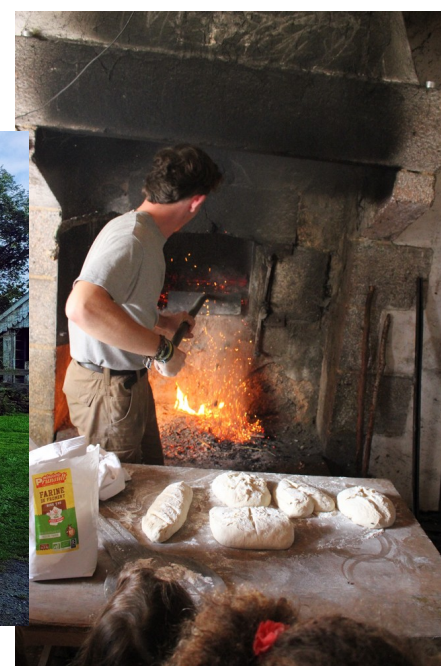
Valentin mettait le pain dans le four.