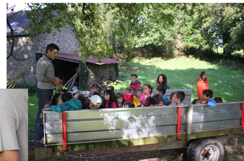
On est allé chez Fine en taxi-ferme.