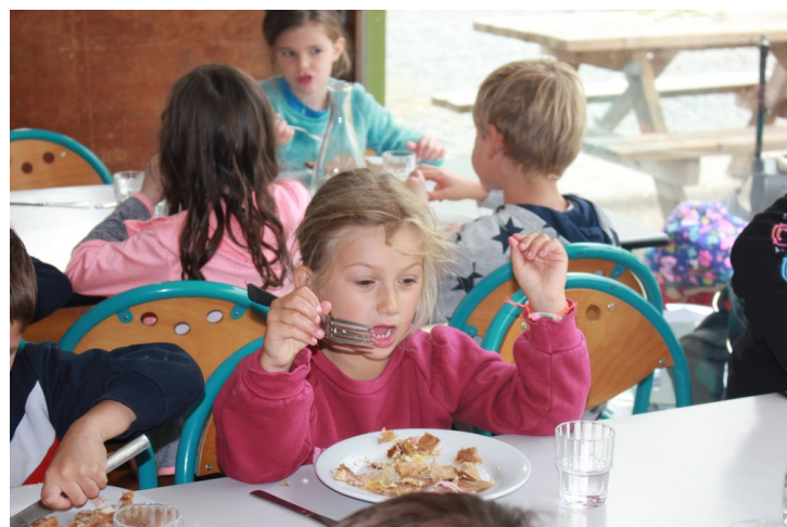
On a mangé des crêpes.