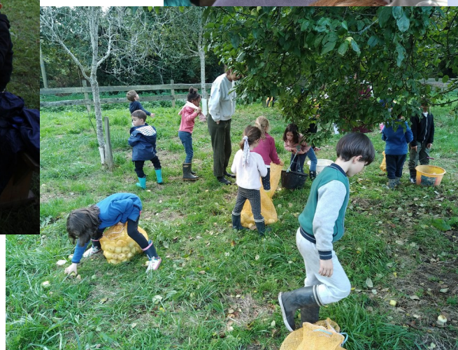
On ramassait des pommes.