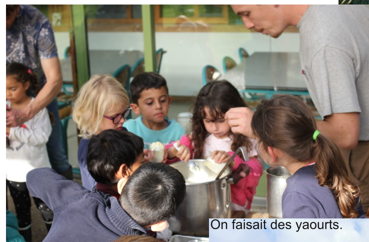
On faisait des yaourts.