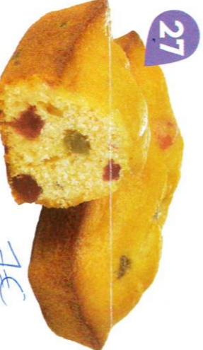
27 CAKES AUX FRUITS 20 emballages individuels - 600 g DDM* : 2 mois