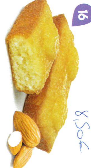
16 FINANCIERS AUX AMANDES 30 emballages individuels - 660 g DDM* : 2 mois