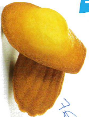
1 MADELEINES NATURE 50 emballages individuels - 880 g DDM* : 2 mois