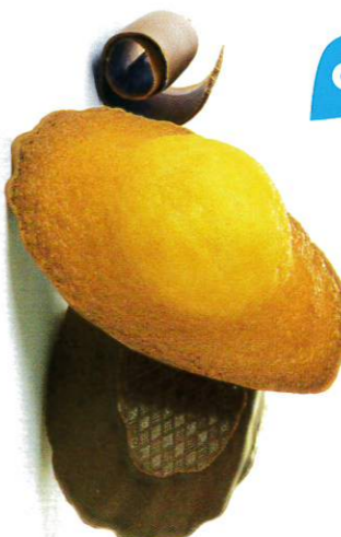
3 MADELEINES CHOCOINOIR 50 emballages individuels - 1080 g DDM* : 2 mois