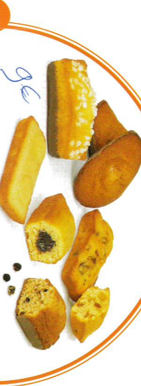
17 ASSORTIMENT DE PÂTISSERIES 30 sachets fraîcheur - 825 g - 5 ChocoPépites & ChocoLait - 5 Géniois ChocoLait - 5 Madelines ChocoLait Caramel - 5 Bijou Myrtille - 5 Financiers aux Amandes - 5 Cakes aux Fruits DDM* : 2 mois