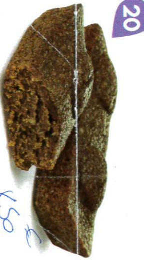
20 MOELLEUX AU CHOCOLAT 30 emballages individuels - 660 g DDM* : 2 mois