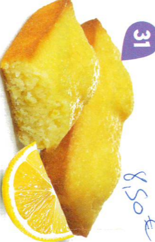
31 FONDANTS CITRON 30 emballages individuels - 660 g DDM* : 2 mois