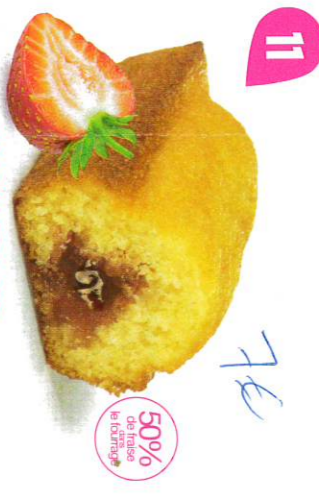
11 BIJOU FRAÏSE 20 emballages individuels - 660 g DDM* : 2 mois