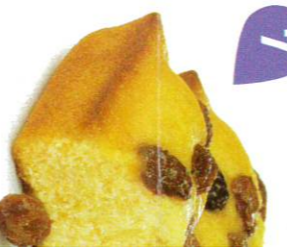
7 CAKE 30 emballage DDM