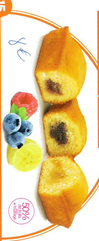
15 PANACH'FRUITS 30 emballages individuels - 990 g 10 Banane - 10 Myrtille - 10 Framboise DDM* : 2 mois