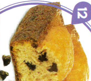
12 CHOCOP 20 emballages indi DDM* : 2