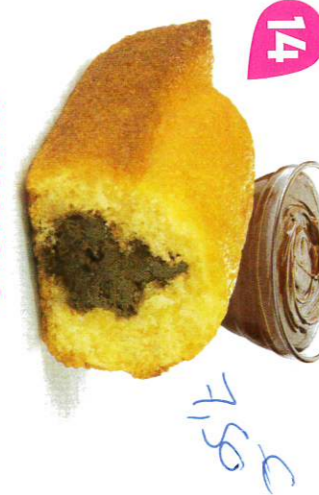
14 BIJOU CACAO 20 emballages individuels - 660 g DDM* : 2 mois