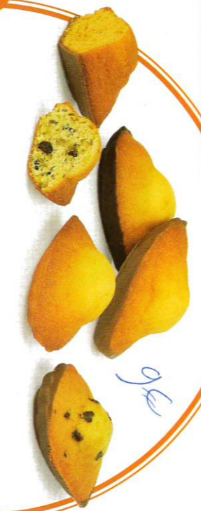
8 FARANDOLE DE MADELEINES 30 sachets fraîcheur - 610 g - 5 Madelines Nature - 5 Madelines ChocoLait - 5 Madelines ChocoNoir - 5 Madelines ChocoPistache - 5 Madelines DoubleChoc - 5 Madelines ChocoLait Caramel DDM* : 2 mois