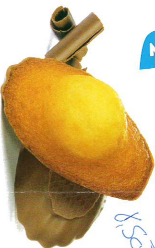
2 MADELEINES CHOCOLAIT 50 emballages individuels - 1080 g DDM* : 2 mois