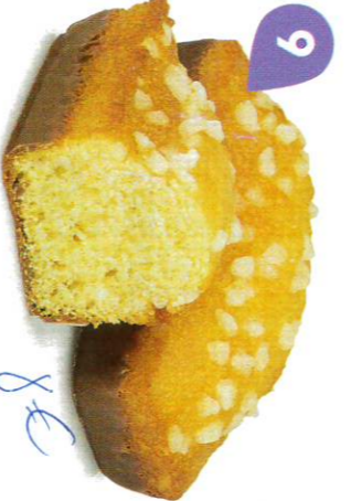
9 GÉNOIS CHOCOLAIT 30 emballages individuels - 920 g DDM* : 2 mois