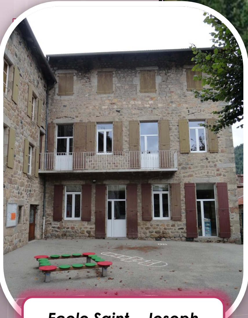
Ecole Saint – Joseph St Martin de Valamas