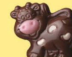
Praliné avec sucre pétillant