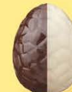
Praliné avec éclats de noisettes