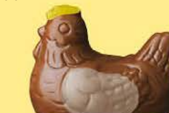
Duo praliné et ganache caramel