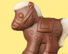
Praliné croustillant aux éclats de crêpe dentelle