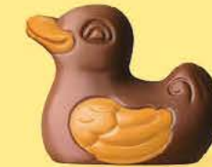
Praliné avec sucre pétillant