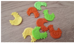
Pour l'instant, s'arranger pour qu'il n'en reste pas. Ici 8 par exemple.