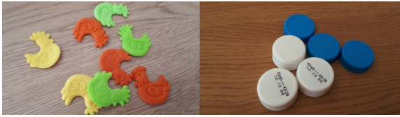
Des objets à distribuer (bouchons, legos, bonbons, boutons...). Il en faut au moins 11.