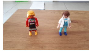
Trois personnages ( je sais il n'y en a que deux sur la photo.