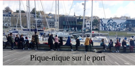
Pique-nique sur le port

Cette journée magnifique était longue, donc ils ont pique-niqué au bord de l'eau, sur l'esplanade du port. C'était l'occasion de jouer au loup ou à un, deux, trois, soleil! Après cela, il a fallu se ranger pour remonter sur la scène et donner le concert final.