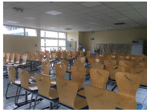
La cantine sur place