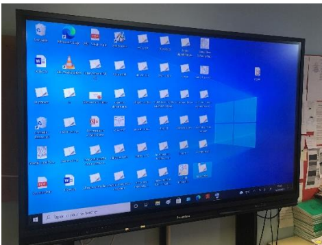
Un VPI dans chaque classe