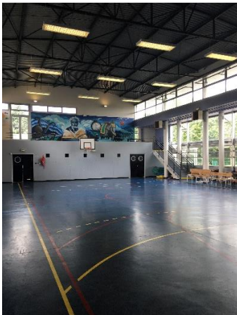
Un gymnase également salle de spectacle