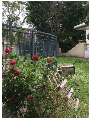
Une école qui pense à la nature