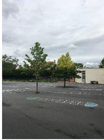
La cour de récréation