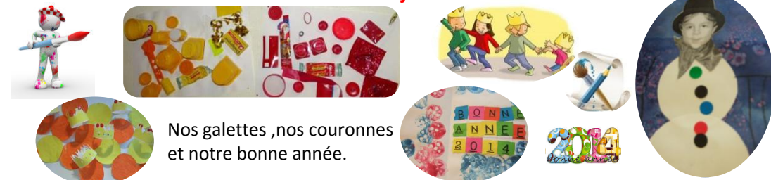
Nos galettes ,nos couronnes et notre bonne année.