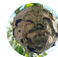
Nid primaire, DANGER Ne jamais s'approcher

Repérer les nids et les signaler au CTM de l'Etain 01 64 10 19 00 ctm.etaain@savigny-le-temple.fr