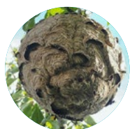
Nid primaire, DANGER Ne jamais s'approcher