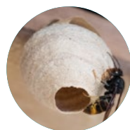
Nid embryon, peu de danger

Enlever les pièges fin avril. Les nouveaux frelons sont actifs, les piéger ne détruit pas la colonie et d'autres insectes vont être pris inutilement dans les pièges.