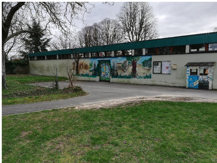
Les entrées et les sorties se font par l'entrée principale de l'école

Vous pouvez formuler une demande de dérogation lors de l'inscription des PS pour aménager l'emploi du temps de votre enfant. Pas de retour possible à 13h20 pour les PS.