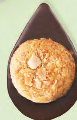
BISCUIT AMANDES Chocolat noir 60% de cacao