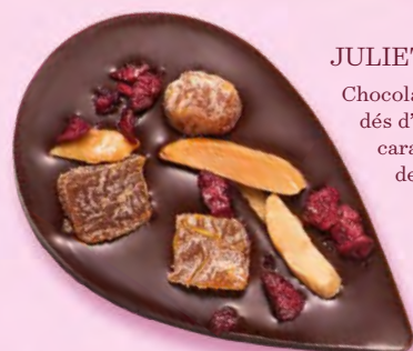
JULIETTE & TOM Chocolat noir 60% de cacao, dés d'abricots secs, amandes caramélisées et morceaux de cerise