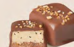
Duo gianduja noisettes et crème au beurre avec éclats de fèves de cacao et de noisettes