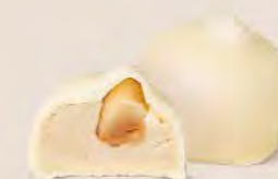
Crème au beurre à la vanille et sa noisette caramélisée

Un grand classique revisité pour apporter du croustillant... et de l'inattendu. Lequel va vous faire fondre en premier ?