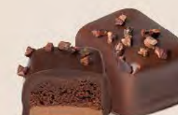
Duo gianduja noisettes et crème au beurre chocolat noir