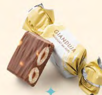
Nougat au miel