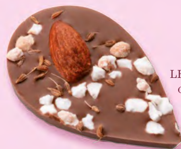
LE SONGE DE JULIETTE Chocolat au lait 35% de cacao, amande, éclats de nougat, brins d'anis

BOITE DE 285 G NET 26 JULIETTES ASSORTIES 4 RECETTES