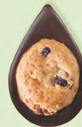
BISCUIT CRANBERRIES Chocolat noir 60% de cacao