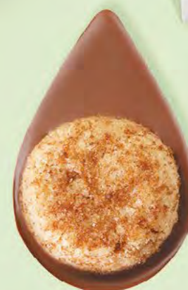
BISCUIT NOISETTES Chocolat au lait 35% de cacao