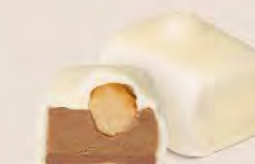
Duo praliné noisettes et crème au beurre au café, avec sa noisette caramélisée