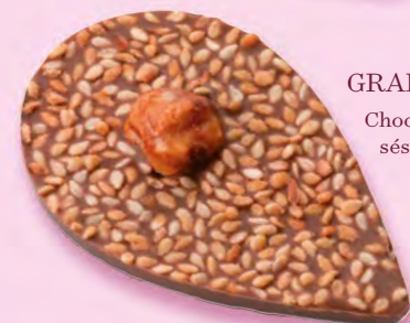
GRAINE DE JULIETTE Chocolat au lait 35% de cacao, sésame, noisette caramélisée