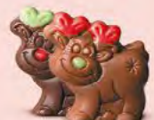
Praliné avec éclats de noisettes torréfiées ou praliné avec éclats de crêpe dentelle