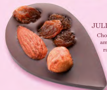
JULIETTE IN THE CITY Chocolat noir 70% de cacao, amande, noisette, raisins secs