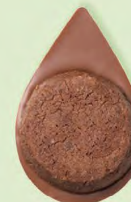
BISCUIT BROWNIE Chocolat au lait 35% de cacao