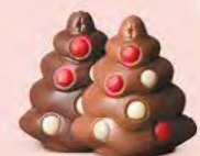
Praliné et sucre pétillant ou praliné tendre