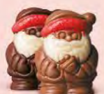
Praliné et éclats de nougat ou praliné et éclats de noisettes caramélisées