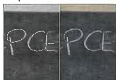
La planche N°6 - 20X30