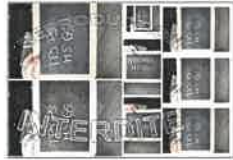
La planche N°2 - 20X30