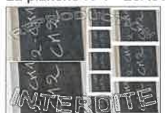
La planche N°3 - 20X30