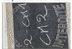
La planche N°4 - 20X30