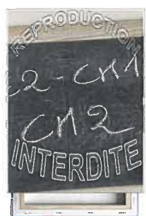
toile 20X30 ou 25x38