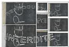
La planche N°2 - 20X30