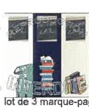
lot de 3 marque-pages