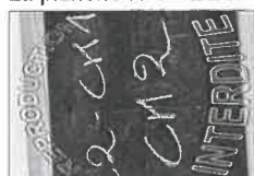
La planche N°5 - 20X30