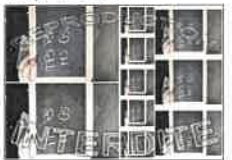
La planche N°3 - 20X30