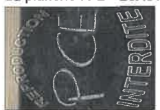
La planche N°4 - 20X30