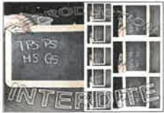
La planche N°1 - 20X30