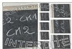
La planche N°1 - 20X30