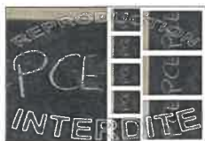
La planche N°1 - 20X30