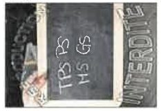
La planche N°4 - 20X30