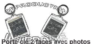
Porte-clé 2 faces avec photos

*** Pour les calendriers, le premier mois sera le mois suivant le mois de livraison. Si l'école est livrée au mois de janvier, le premier mois visible sera le mois de février.