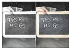
La planche N°6 - 20X30