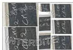
La planche N°2 - 20X30