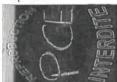
La planche N°5 - 20X30