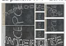
La planche N°3 - 20X30