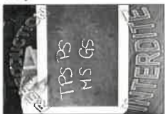
La planche N°5 - 20X30