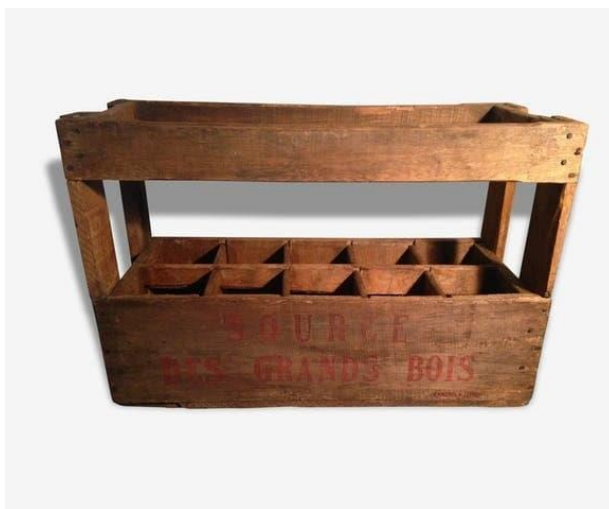
Caisse à Vin