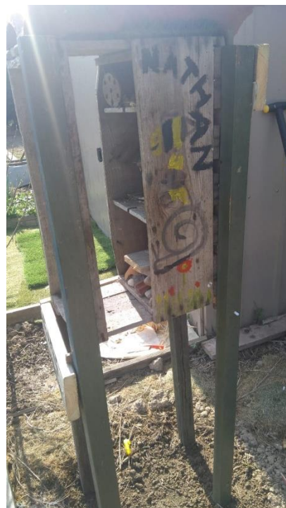
Le côté de Nathan