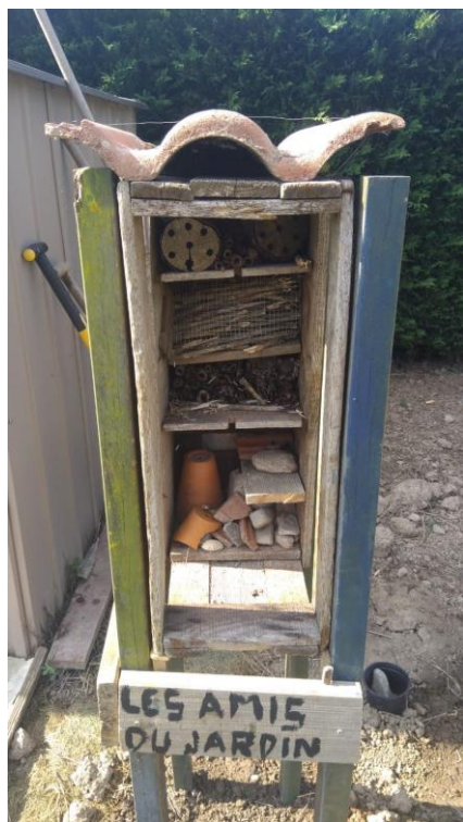
Hôtel à insectes

Ci-joint une fiche expliquant tous les insectes utiles et amis du jardin. Chaque insecte trouvera sa place dans les étages de l'Hôtel. En complément nous avons semé au pied de l'Hôtel de la bourrache, une plante très mellifère ( une plante mellifère est une plante produisant de bonne quantité de nectar et de pollen, accessible par les abeilles )