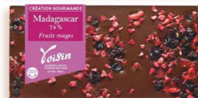
CHOCOLAT NOIR FRUITS ROUGES 110 gr - 7,00€ Ref : 27.