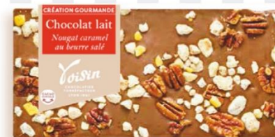
CHOCOLAT AU LAIT NOUGAT ET CARAMEL BEURRE SALÉ 110 gr - 7,00€ Ref : 26.