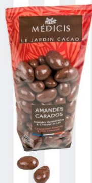
CARADOS Amandes caramélisées et chocolat au lait 200 gr - 8,75€ Ref : 29.