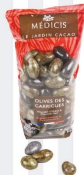
OLIVES DES GARRIGUES Amandes grillées & chocolat noir 200 gr - 8,75€ Ref : 31.