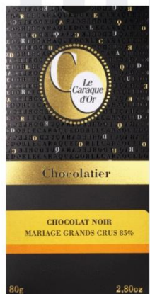
CHOCOLAT NOIR MARIAGE GRANDS CRUS 85% 80 gr - 5,10€ Ref : 22.