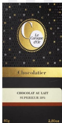
CHOCOLAT AU LAIT SUPÉRIEUR 38% 80 gr - 5,10€ Ref : 20.