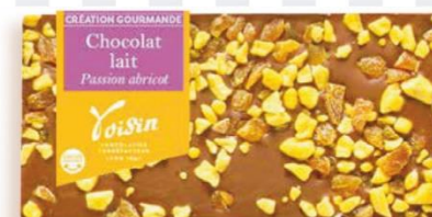
CHOCOLAT AU LAIT PASSION ABRICOT 110 gr - 7,00€ Ref : 25.