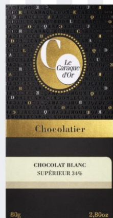
CHOCOLAT BLANC SUPÉRIEUR 34% 80 gr - 5,10€ Ref : 23.