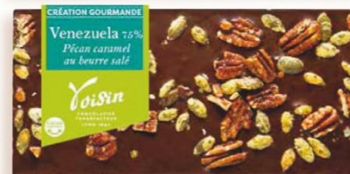
CHOCOLAT NOIR PÉCAN Caramel au Beurre Salé 110 gr - 7,00€ Ref : 24.