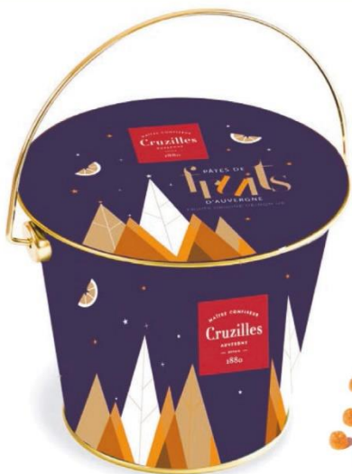
SEAU MÉTAL FESTIF PÂTES DE FRUITS FORME PERLE Fraise, mandarine, poire saveur verveine 250gr - Ref : 40 - 14,00€