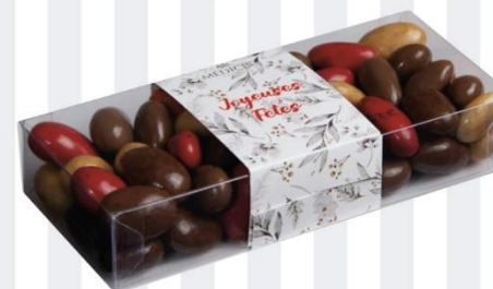
COFFRET NOËL Assortiments amandes chocolat 250 gr - 13,50€ Ref : 39.