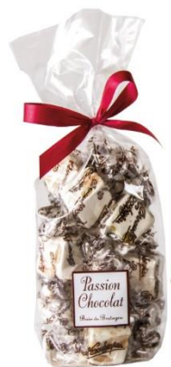
NOUGATS TENDRES Papillotes de nougat de Montélimar (miel, amandes, pistaches) 100gr - environ 12 pièces Ref : 47 - 6,90€