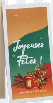
ÉTUI JOYEUSES FÊTES Amandes chocolat 180 gr - 11,95€ Ref : 38.