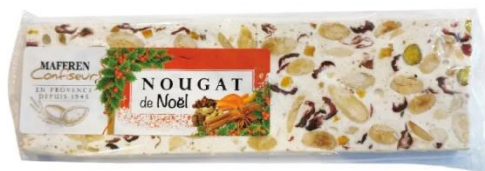
BARRE NOUGAT DE NOËL 100gr - Ref : 45 - 6,80€