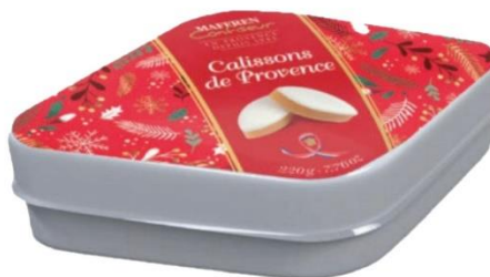
BOÎTE TRADITIONNELLE CALISSON 200gr - Ref 43 - 18,50€