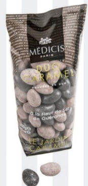
DUO CARAMEL Croustillant de nougatine enrobé de chocolat au lait caramel 200 gr - 8,75€ Ref : 30.