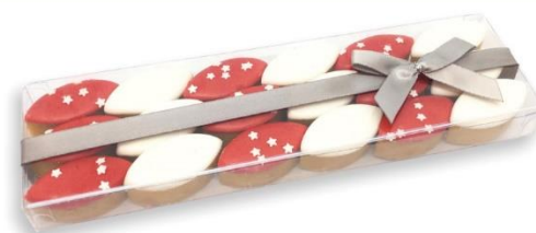
RÉGLETTE DE MINIS-CALISSONS 18 calissons de Provence 110gr - Ref : 42 - 10,50€