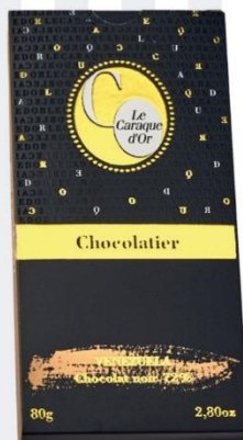
CHOCOLAT NOIR ORIGINE VÉNEZUÉLA 72% 80 gr - 5,10€ Ref : 21.