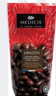
LIMAZZO Amandes grillées chocolat au lait et noir citron et basilic 200 gr - 8,75€ Ref : 33.