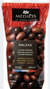
MALAYA Amande & Noisette Chocolat lait & noir Cannelle, mandarine 200 gr - 8,75€ Ref : 32.