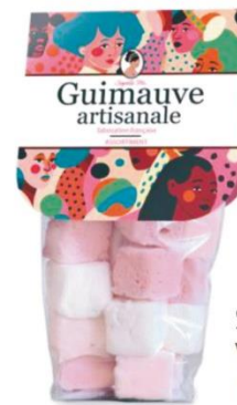
SACHET ASSORTIMENT GUIMAUVES Vanille, framboise, mirabelle 100gr - Ref 49 - 8,00€