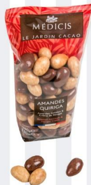
QUIRIGA Amandes grillées à la crème de nougat et chocolat 200 gr - 8,75€ Ref : 28.