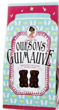
POCHETTE OURSONS 10 Oursons guimauve chocolat au lait 127gr - Ref 48 - 7,00€