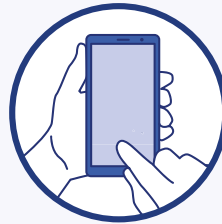
Utilisation des outils numériques (TousAntiCovid)

Numéro gratuit d'information sur le coronavirus : 0 800 130 000