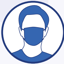
Port du masque obligatoire pour les élèves à partir du CP